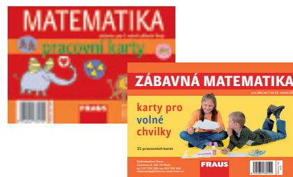
Pracovní karty pro domácí procvičování